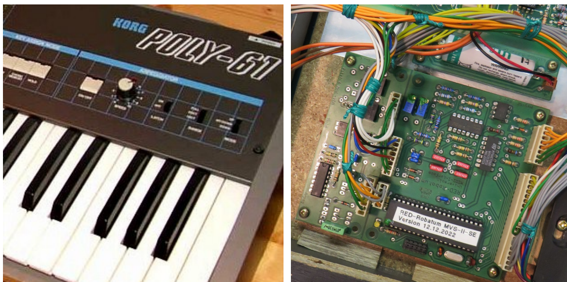
Das MIDI-for-Vintage-Synth-Interface im Korg Poly-61