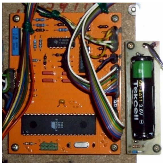
Das MIDI-for-Vintage-Synth-Interface im Korg Poly-61